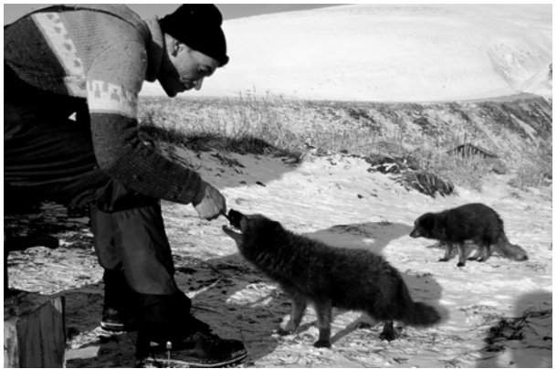
Junger Polarfuchs (oben). Der Autor beim Füttern von Polarfüchsen (unten).